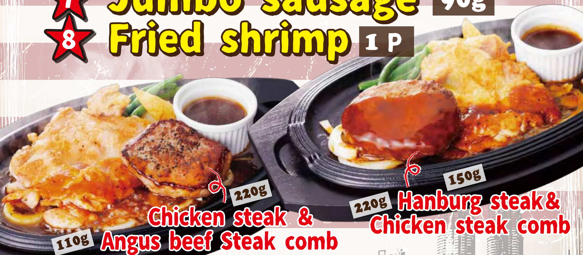
110g Angus beef Steak comb 220g Chicken steak &