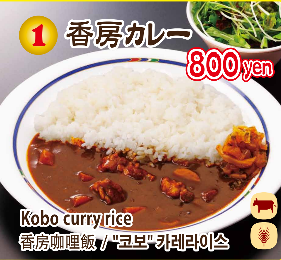
Kobo curry rice 香房咖喱飯 / "코보" 카레라이스