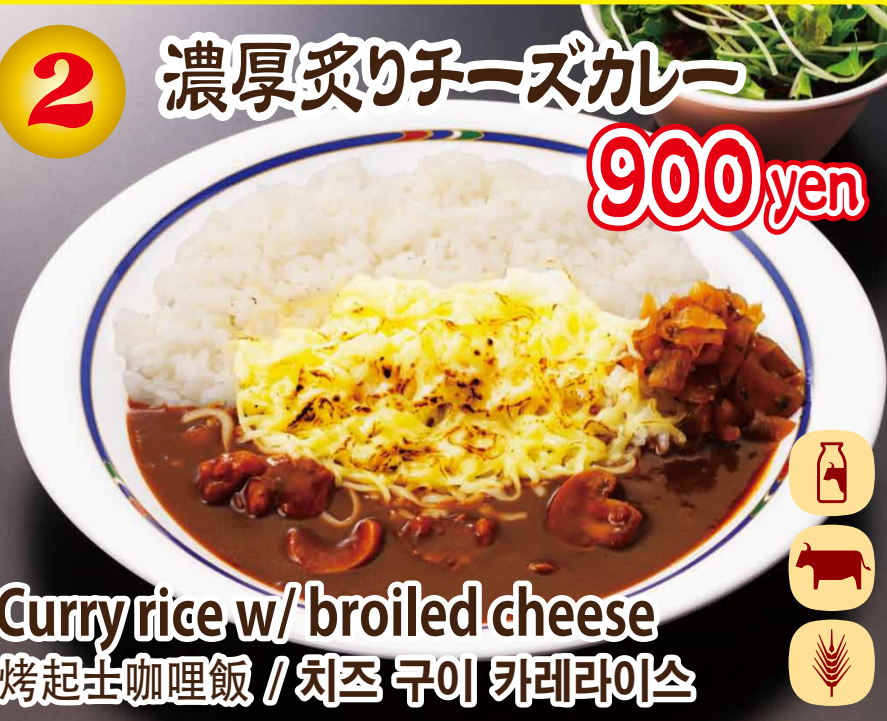
Curry rice w/ broiled cheese 烤芝士咖喱飯 / 치즈 구이 카레라이스