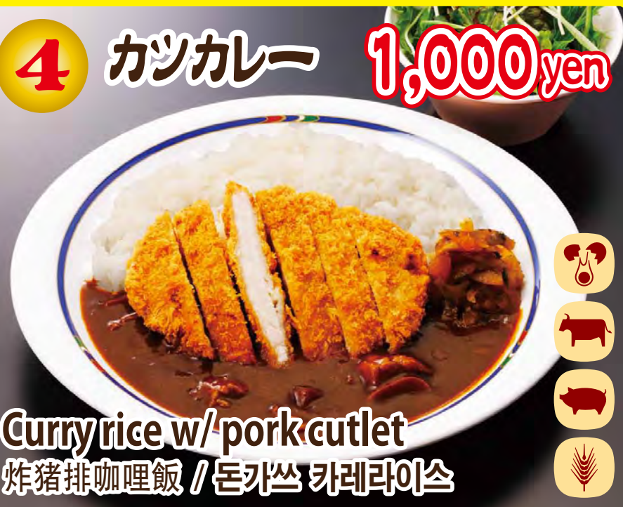
Curry rice w/ pork cutlet 炸猪排咖喱飯 / 돈가쓰 카레라이스