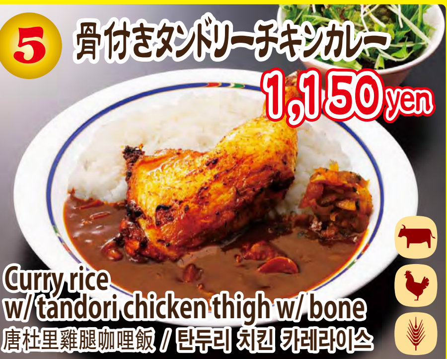
Curry rice w/ tandoori chicken thigh w/ bone 唐杜里雞腿咖喱飯 / 탄두리 치킨 카레라이스