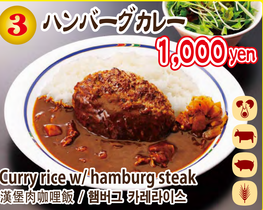
Curry rice w/ hamburger steak 漢堡肉咖喱飯 / 햄버크 카레라이스